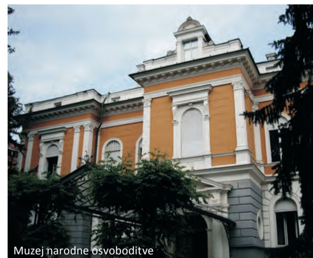
Muzej narodne osvoboditve

Delavnice: likovna, arheološka in literarna poustvarjalnica