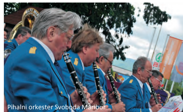
Pihalni orkester Svoboda Maribor