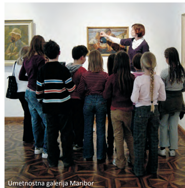
Umetnostna galerija Maribor

Delavnice: likovna, arheološka in literarna poustvarjalnica