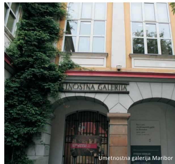
Umetnostna galerija Maribor

Delavnice: literarna, likovna in arheološka poustvarjalnica