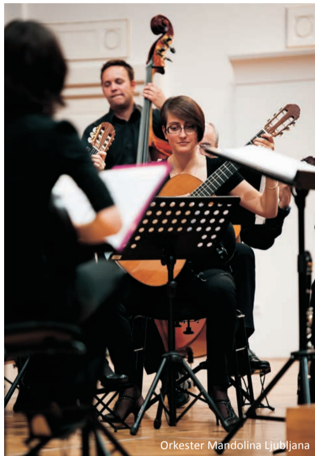
Orkester Mandolina Ljubljana