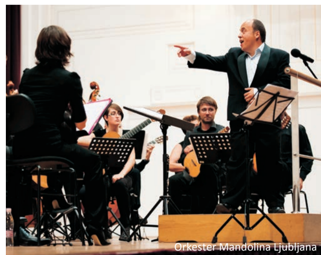
Orkester Mandolina Ljubljana

Do nedavnega mandoline niso poučevali na glasbenih šolah, zato so člani orkestra svoje igranje izpopolnjevali na številnih mandolinskih seminarjih v tujini. Orkester med svoje največje dosežke šteje številna zlata priznanja in nagrade Srečanj tamburašev in mandolinistov Slovenije, zmage na treh mednarodnih tekmovanjih (leta 2000 v Falkensteinu pri Frankfurtu na Maini, leta 2005 in 2011 v hrvaškem Imotskem) ter udeležbo na pomembnih mednarodnih mandolinskih festivalih v Bambergu (Nemčija), Logrognu (Španija), Remiremontu (Francija), Pazardjiku (Bolgarija) in drugod. S svojim klasičnim in popularnim programom bodo člani orkestra našim abonentom pripravili zabavno učno uro o mandolini in dokazali, da je to glasbilo primerno tudi za povsem sodobno glasbo.