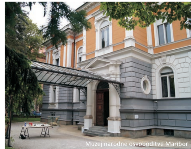
Muzej narodne osvoboditve Maribor

Delavnice: tehnična, arheološka in likovna poustvarjalnica