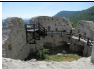
Stari grad Slovenske Konjice

Ustavili se bomo v novi sodobni vinski kleti na malici na žlico ob kozarcu Konjičana.