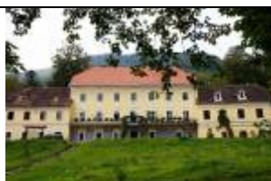
Dvorec Trebnik Slovenske Konjice