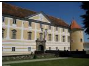
Grad Slovenska Bistrica

Odhod iz Cirkulan ob 7:30, Ptuj pri Qlandiji 8:00