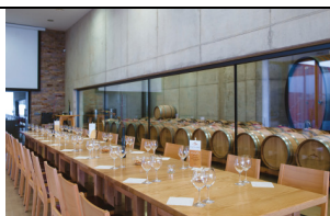
Vinska klet Zlati grič Slovenske Konjice

Danes ima blagovna znamka Dvorec Trebnik pod svojim okriljem številne naravne izdelke, ki jih je možno v trgovinici tudi kupiti.