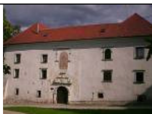
Župnišče Slovenske Konjice

Ogledali si bomo viteško dvorano, grajsko kapelo in nekaj grajskih zbirk.