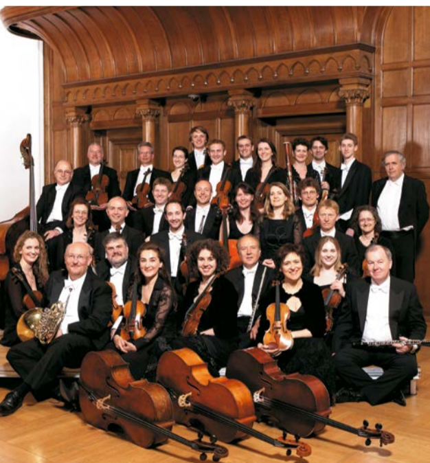
Angleški komorni orkester

umetniški vodja Koncertne poslovalnice Narodni dom Maribor