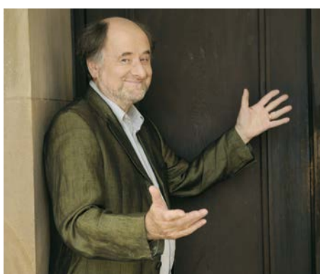
Sir Roger Norrington