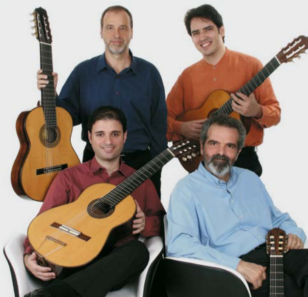
Brazilski kvartet kitar

Spored Heitor Villa-Lobos: Afriški ljudski plesi Cirande (izbor) Godalni kvartet št. 12 Enrique Granados: Punčka iz suite Goyescas, op. 11 Isaac Albéniz: Malaga iz suite Iberia Ronaldo Miranda: Resne variacije na temo Anacleto de Medeirosa Mozart Camargo Guarnieri: Črnski ples / Valček / Brazilski ples Francisco Mignone: Lundu / Lenda / Congada