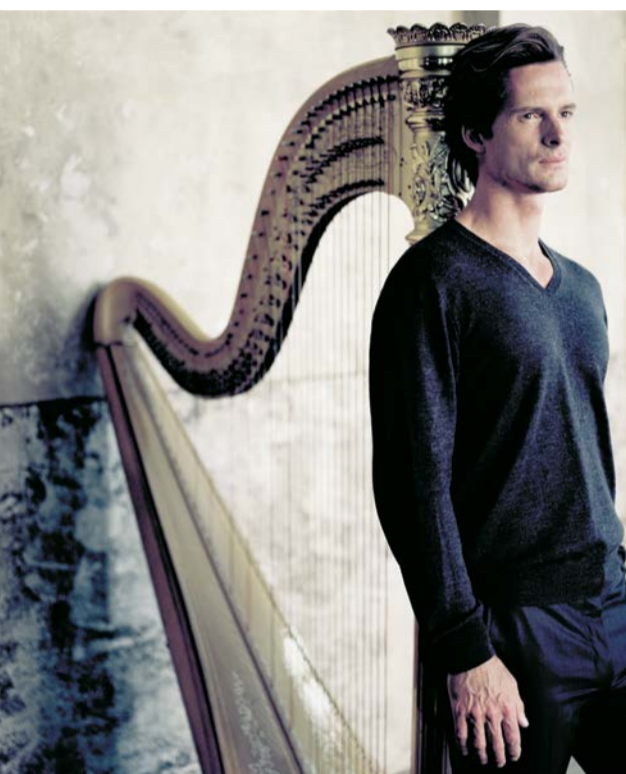
Xavier de Maistre

leta 2016, torej že naslednjo sezono, bo naša Koncertna poslovalnica praznovala 70-letnico obstoja. Vsekakor priložnost za slavlje, a hkrati tudi za premislek o preteklosti, začetkih in sedanjosti, o tem, kaj se iz prehojene poti lahko naučimo. Radi verjamemo, da tradicija in izkušnje prinašajo modrost in omogočajo napredek. In čeprav se zavedamo, da pri umetnosti nikoli ni tako enostavno – saj težko govorimo o premočrtnem zgodovinskem razvoju, pač pa prej o spremembah okusa, okoliščin, slogov ... – se ne moremo izogniti primerjavam in občutku, da bi po sami naravi stvari vendarle morali iti »naprej«. Ta občutek nam je trn v peti še posebej zadnjih nekaj sezon. Pred skoraj sedemdesetimi leti so namreč naši agilni predhodniki ustanovili prvo koncertno poslovalnico na področju nekdanje Jugoslavije in kmalu jim je uspelo pritegniti izjemne glasbenike, ki Maribora pred tem niso poznali na zemljevidu uglednih glasbenih središč. Z ugledom prireditelja pa sta rasla tudi zanimanje in privrženost občinstva in tako danes stojimo na točki, ko Maribor in njegova Koncertna poslovalnica veljata za pomembna pobudnika in akterja kulturnih prireditev v srednji Evropi. Vrhunska mednarodna koncertna ponudba je sestavni del kulturnega utripa mesta.