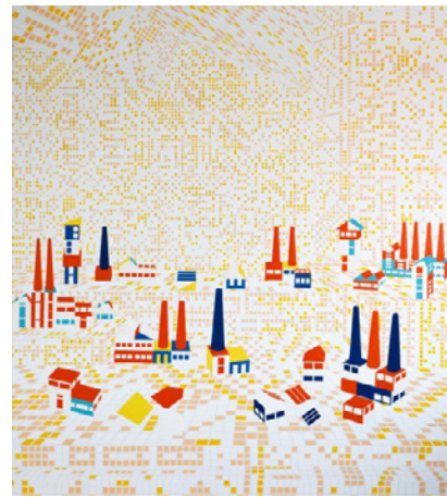
Farah Atassi: Worshop III , 2012

Projekt se neposredno sklicuje na delo Boîte en valise ali Škatla v kovčku , ki ga je Marcel Duchamp ustvaril, ko se je izselil v ZDA, ter ponuja refleksijo o kroženju umetnin in promociji umetnikov. V tem kontekstu se petnajst umetnikov loteva vprašanja predstavitve svoje umetnosti v neprestano spreminjajočem se svetu. Vsak je bil povabljen k sodelovanju z izrecnim navodilom, naj ustvari delo »v kovčku«, najsi gre za sliko, instalacijo, video ali performans. Namen te potujoče razstave je v mednarodnem okolju izpostaviti ustvarjalnost skupine obetajočih mladih umetnikov, diplomantov francoskih likovnih akademij.