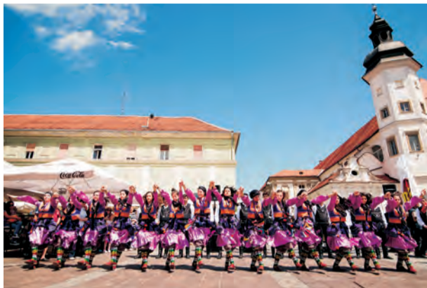
za pravo doživetje mesta pa je po mnenju Rough Guides prav v času mednarodnega Festivala Lent.

Maribor je prepričal predvsem s svojim čudovitim starim mestnim jedrom, sprehodi ob Dravi, eno najstarejših evropskih sinagog, najstarejšo trto na svetu ter bližnjim Pohorjem. Najprimernejši čas